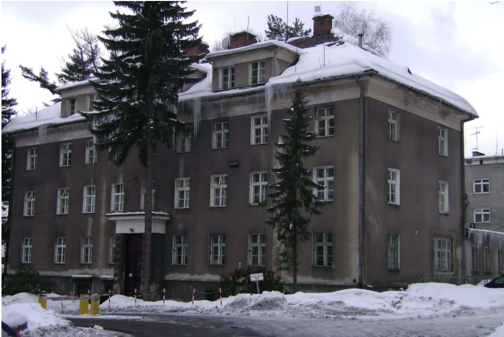
Pawilon 2c przed termomodernizacją