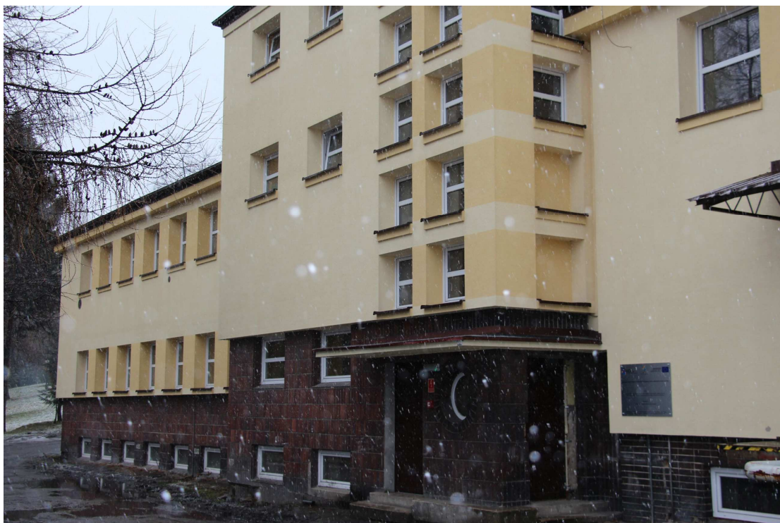
Budynek zaplecza technicznego z kotłownią po termomodernizacji