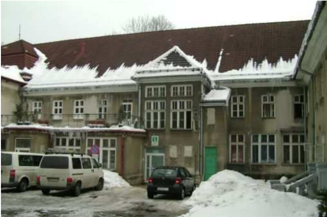
Pawilon 1 przed termomodernizacją