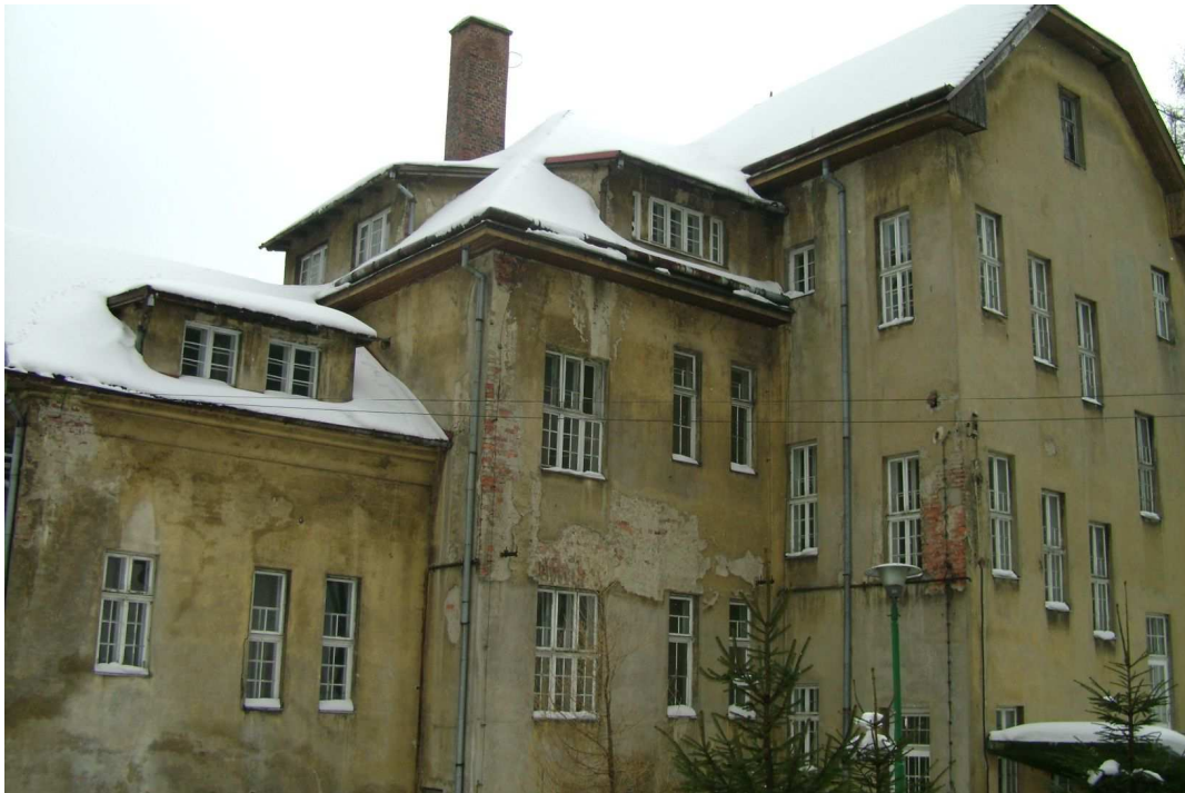
Pawilon 3 przed termomodernizacją