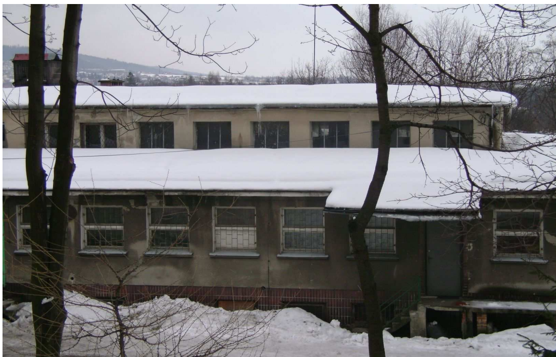
Budynek zaplecza technicznego z kotłownią przed termomodernizacją